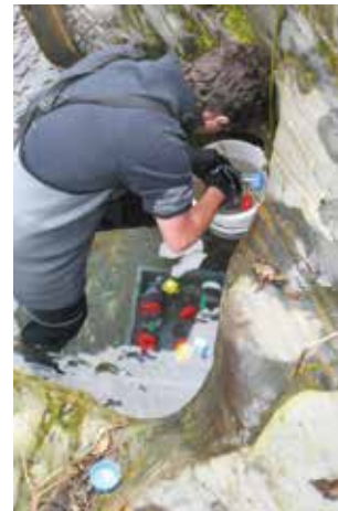
Installation des cages contenant les gammares sur le gave de Cauterets

Les gammares sont directement immergés dans les eaux du gave pour plusieurs jours. Une fois les crevettes recueillies, les métaux qu'elles ont accumulés (cadmium, plomb, arsenic, chrome, zinc...) sont mesurés en laboratoire pour déterminer le niveau de toxicité du cours d'eau et ses effets en terme de mortalité, alimentation, neurotoxicité et fertilité.